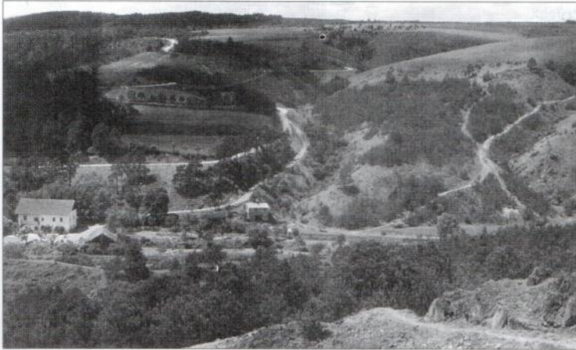
2. Jižní svahy dnešní mohelenské hadcové stepi pokrývaly po staletí vinohrady.

Domníváme se, že Geisselovo stanovisko bylo oprávněné a je možné se s ním plně ztotožnit.